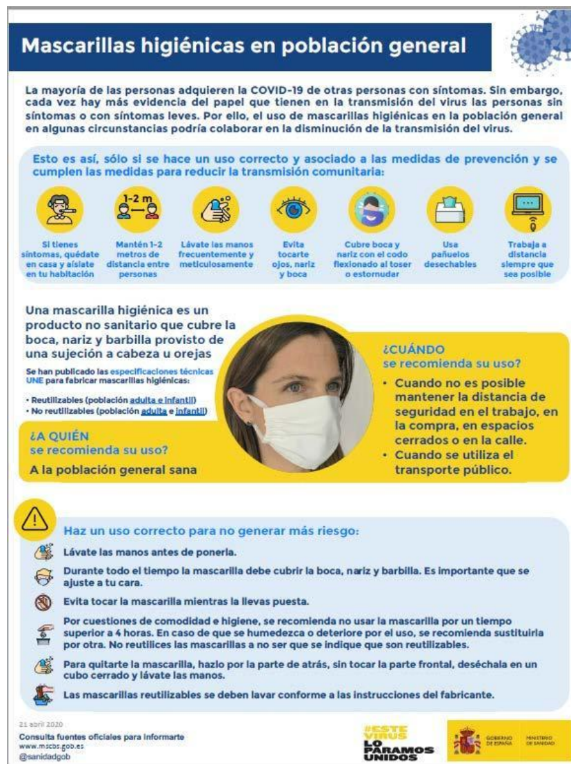
Mascarillas higiénicas en población general (Ministerio de Sanidad, 2020)

Nota: las mascarillas quirúrgicas y las mascarillas higiénicas no son consideradas EPI.