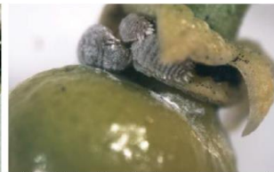
Fig. 11. Localización de D. aberiae en el fruto, bajo el cáliz. Beltrá A. et al, 2013