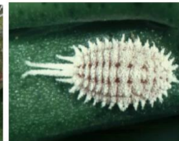
Fig. 4. Hembra adulta de Pseudococcus calceolariae .