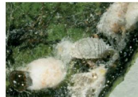
Fig. 10. Daños ocasionados por la emisión de melazas de D. aberiae . Beltrá A. et al, 2013