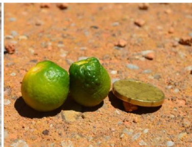
Figura 14. Protuberancias en los frutos producidas por D. aberiae

Imágenes extraídas del Plan Nacional de Contingencia Delottococcus aberiae .