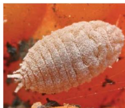
Fig. 1. Hembra adulta de Delottococcus aberiae .