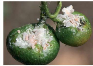
Figuras 6, 7 y 8. Deformaciones de frutos causadas por D. aberiae . Beltrá A. et al, 2013