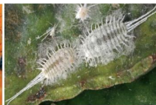
Fig. 3. Hembras adultas de Pseudococcus longispinus .