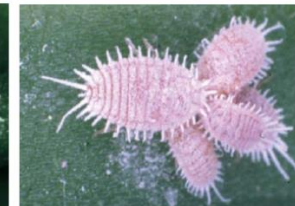
Fig. 5. Ninfas y hembras adultas de Pseudococcus viburni .