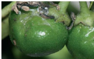
Fig. 9. Deformaciones de frutos causadas por D. aberiae . Beltrá A. et al, 2013