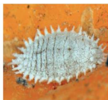
Fig. 2. Hembra adulta de Planococcus citri .