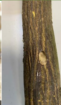
Inicio de los daños