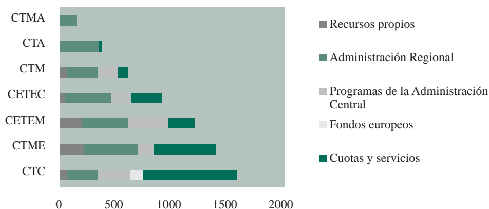
Figura 11. Desglose de ingresos de los Centros Tecnológicos de la RM por origen (año 2001)

Unidades: Miles de euros.