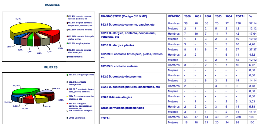
DISTRIBUCIÓN DE DERMATOSIS PROFESIONALES SEGÚN DIAGNÓSTICO