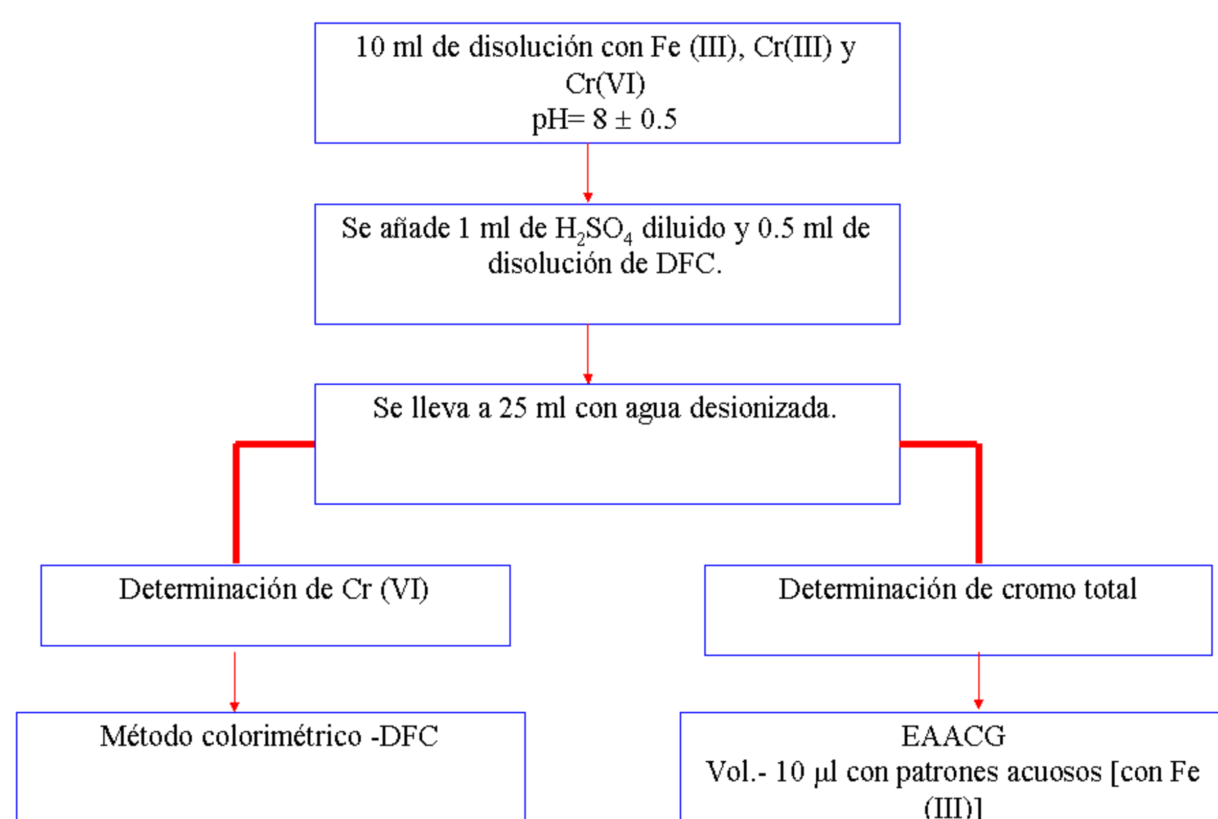
Diagrama de flujo