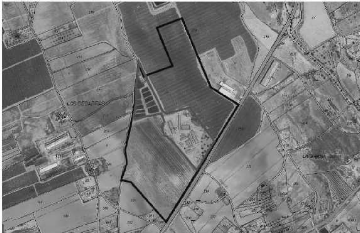
DETALLE DE LA GRANJA EN EL POLÍGONO 17, PARCELA 217 DE FUENTE ALAMO