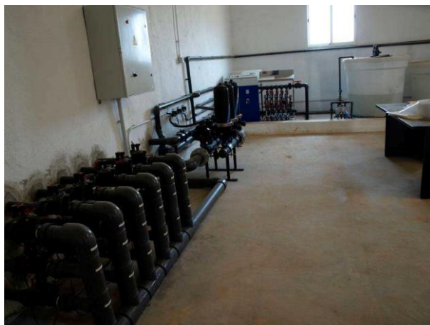
Cabecal de riego Las Nogueras de Arriba.