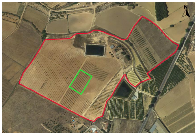
Ubicación granados en CDA Las Nogueras de Arriba.

Se encuentra situado junto al camino de la finca, entre los almendros intensivos y albaricoqueros tardíos, pequeña parcela con coordenadas UTM-Huso 30 (ETRS-89); 595813/42100751, situada en el CDA Las Nogueras de Arriba, propiedad de la Comunidad Autónoma de la Región de Murcia, catastralmente en la parcela 385 del polígono 129 en el paraje Los Prados, Caravaca de la Cruz.