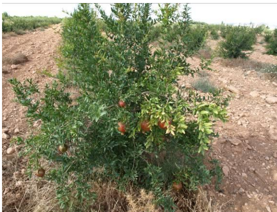
Parcela de ensayo de granados en Finca las Nogueras.

Esta especie presenta un gran número de variedades cultivadas, siendo unos de los principales problemas la falta de selección del material vegetal y el estudio de las