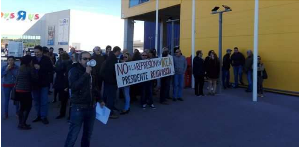
Protestas ante el despido de un sindicalista en la empresa de Ikea hace dos meses MURCIA

Asimismo, "la precariedad laboral en estos años", según un extrabajador, "se ha incrementado y varios asalariados encadenaban contratos temporales de un año durante un período largo". En este sentido, han señalado que cuando estas prácticas se denunciaban desde el sindicato "la empresa achacaba la no renovación de un contrato fijo a la acción sindical y no a la vulneración de derechos de la empresa". IKEA ha negado la concatenación de las contrataciones, afirmando que los indefinidos "han aumentado un 20%".