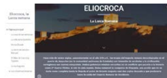
Figura 4. Página principal de la web.

Enlace: sites.google.com/view/elioocalorcaromana