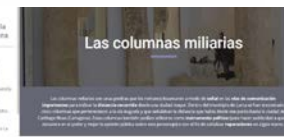
Figura 5. Ejemplo de página sobre yacimiento romano.