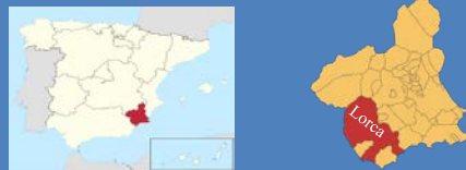
Figura 1. Fuente: creativecommons.org Figura 2. Fuente: creativecommons.org